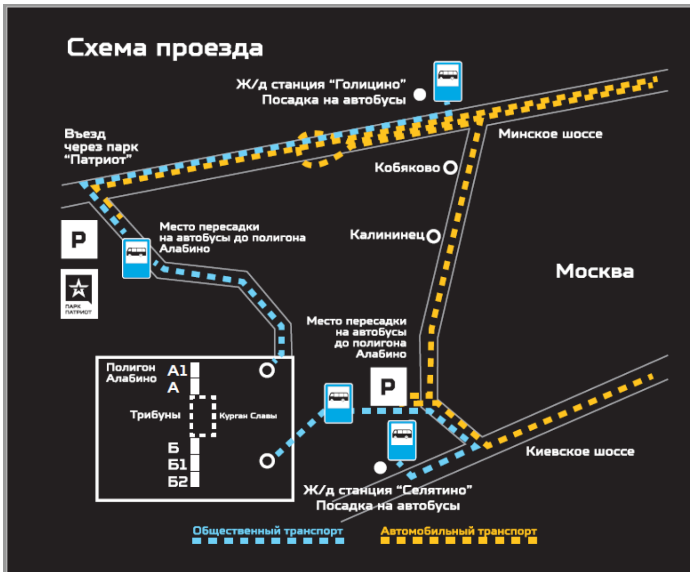
Схема проезда к месту проведения международного конкурса «Танковый биатлон-2019» на полигоне «Алабино»