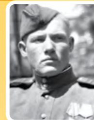
М.А. Егоров (1923–1975)