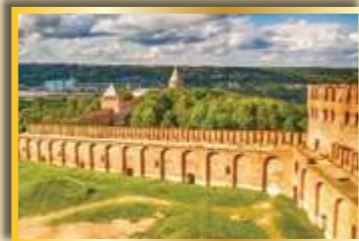
Смоленская крепостная стена

Сегодня в Смоленской области старина и современность переплелись неразрывно, возрождённые здания восхищают своим архитектурным обликом, а её административный центр — один из красивейших городов средней полосы России. На территории области около 750 промышленных предприятий, хорошо развит агропромышленный комплекс, в области работает 10 вузов. Смоленская область по праву гордится статусом региона для жизни с прекрасной инфраструктурой для всех категорий граждан.