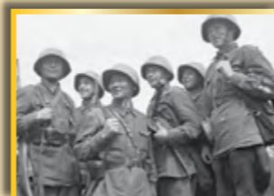
Военные РККА под Смоленском

Смоленское сражение (10 июля–10 сентября 1941 года) стало большим достижением в борьбе против фашистской оккупации. Комплекс операций по наступлению и обороне четырёх фронтов позволили разрушить планы и отнять время у фашистов. Большая численность немецких войск окружила Смоленск, а также ближайшие города к нему. Но Советской Армии удалось собрать все свои силы, организовать Западный фронт. Основные столкновения произошли под Бобруйском, Великолукском, Гомелем, Духовщинском, Ельнинском, Могилевом, Полоцком, Смоленском, Рославль-Новозыбковом. Советское командование издало указ о подготовке оборонительно-наступательных мер по защите пути к Москве и оттеснению немцев от линии фронта и Смоленска. Немецкое командование отдало приказ прорвать Западный фронт для дальнейшего продвижения к столице. Из нескольких круп-