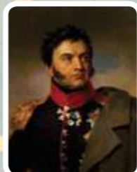
Н.Н. Раевский (1771–1829)