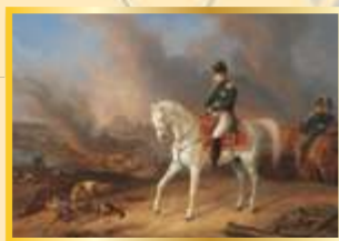
Наполеон на фоне горящего Смоленска. Альбрехт Адам