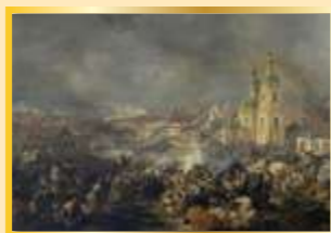
Битва под Вязьмой. 22 октября 1812 года. Петер фон Гесс

Сражение под Вязьмой русского авангарда с отступающей французской армией состоялось 22 октября 1812 года. Поражение лучших французских корпусов окончательно подорвало моральный дух в наполеоновских войсках, с этого момента их отход превратился из вынужденного тактического манёвра в катастрофическое отступление.