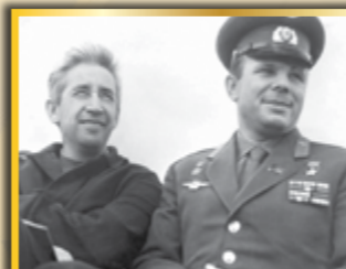
К.П. Феоктистов и Ю.А. Гагарин

Константин Петрович Феоктистов — проектировщик космических кораблей, космонавт-исследователь , Герой Советского Союза , почетный гражданин Воронежа.