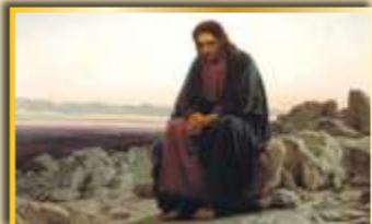
Христос в пустыне