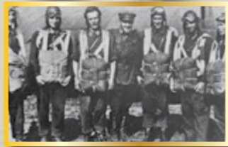
2 августа 1930 года

Леонид Григорьевич Минов 26 июля 1930 года осуществил первый в истории СССР учебно-тренировочный прыжок с парашютом с самолёта. Этот день считается днём рождения советского парашютного спорта. 2 августа 1930 года в двух километрах от Воронежа был сброшен первый советский военно-воздушный десант, состоявший из двенадцати человек. Ныне 2 августа празднуется день Воздушно-десантных войск .